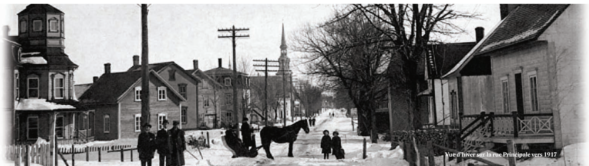
Vue d'hiver sur la rue Principale vers 1917

Le début des années 2000 fut tout aussi très important pour le développement du village en raison de la fusion des municipalités de Saint-Flavien Village et Saint-Flavien Paroisse. Dans un souci d'embellissement, la municipalité installa en 2002 des luminaires décoratifs sur la rue Principale, ce qui contribue à la renommée de Saint-Flavien.