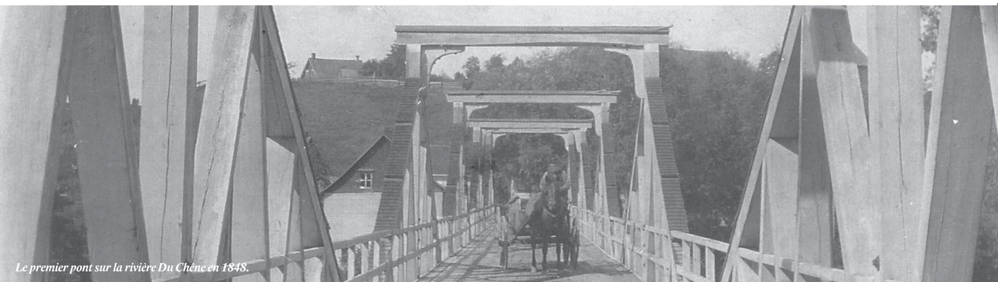
Le premier pont sur la rivière Du Chêne en 1848.

Ce projet a été rendu possible grâce à la contribution de la municipalité et de ses partenaires.