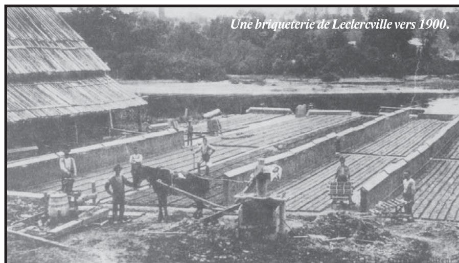
Une briqueterie de Leclercville vers 1900.